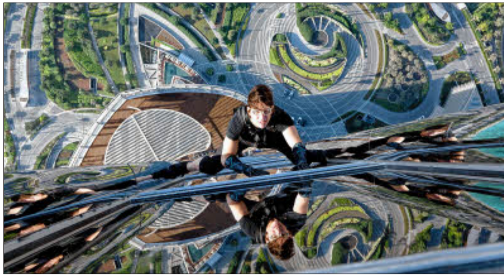
Superagent Ethan Hunt (Tom Cruise) in gefährlicher Mission.