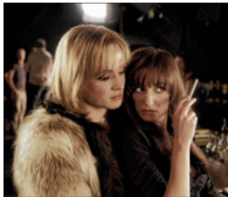
Eine Glanzrolle für Matthias Schweighöfer.

aus und seine Brüder mischen das gesamte Filmset auf. Am liebsten würde er aus dem Film aussteigen - hätte er sich nur nicht in seine Partnerin, Superstar Sarah Voss, verliebt.